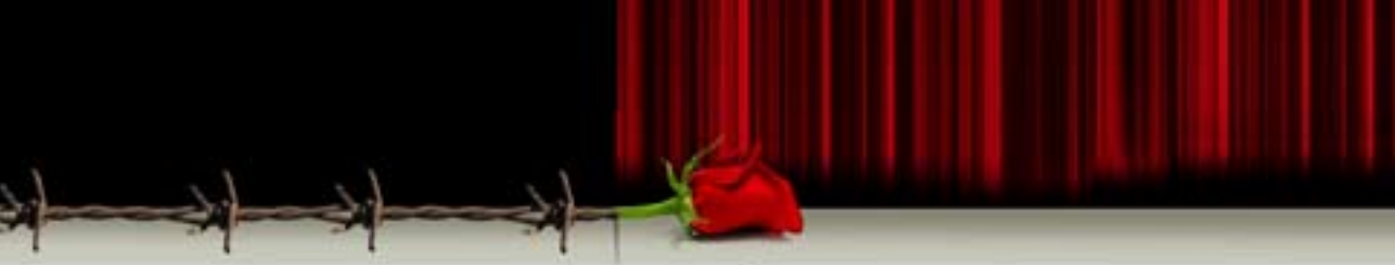
עיבוד מחשב: אילי קוגום