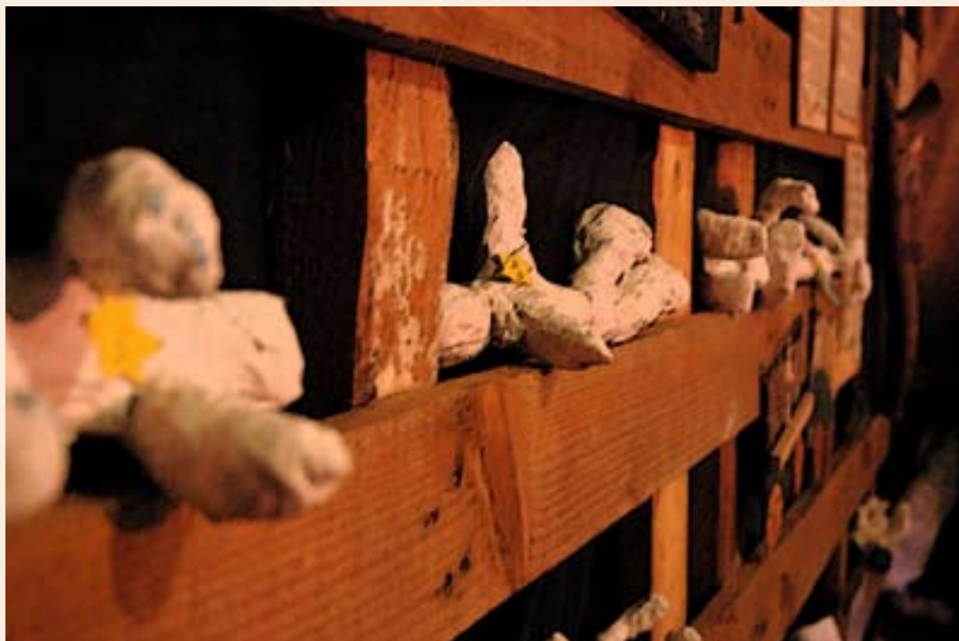
זמק ממייזג "והזרת לבניך - לזכור ולא לשכוח" בחדר העדות בבניס "דמות וייצמן" ביבנה.

סיפור השרדותם ותקומתם של ניצולי השואה תושבי יבנה תלמידי שכבה ט' בחט"ב גינסבורג "האלון" ו"האורן" ינואר 2010 יום השואה הבינלאומי