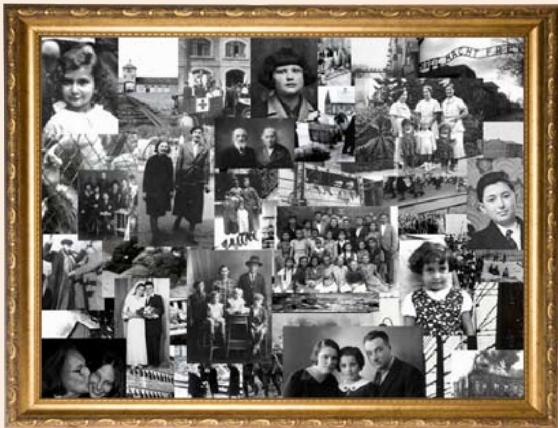
עבודת קולאז' של אורי קוונט